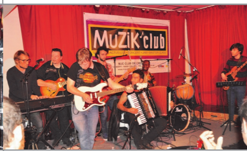
Jam avec les musiciens amateurs