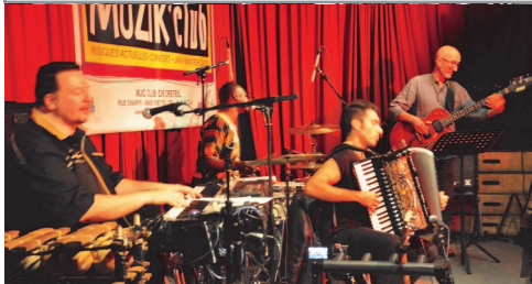
Jam avec les musiciens du collectif Braslavie