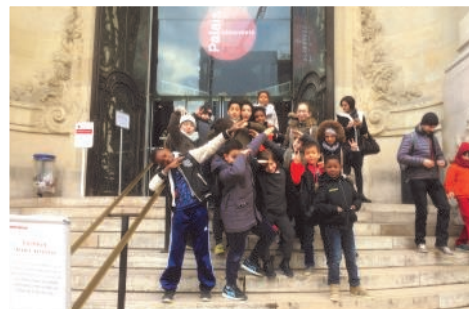
PALAIS DE LA DÉCOUVERTE