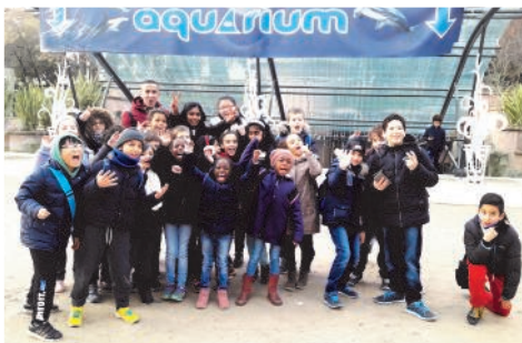
AQUARIUM DE PARIS