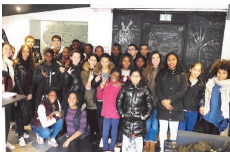
ESPACE GAME PARIS