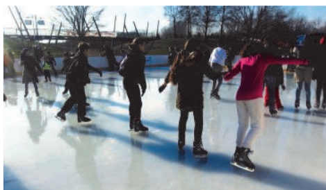
VILLAGE SPORTIF D'HIVER DE VAIRES-TORCY