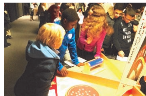
PALAIS DE LA DÉCOUVERTE