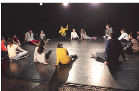
PASSEPORT JEUNES THÉÂTRE