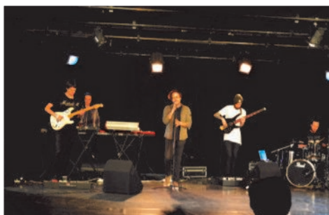
Spectacle au théâtre avec le groupe White Line