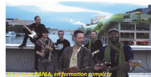
Le groupe BANIA, en formation complète

Le premier orchestre, de style Jazz/Bossa Nova, réunira guitare basse, batterie, percussions, guitare, piano, flûte/chant, sax alto, sax ténor, sax baryton, trompette et trombone.