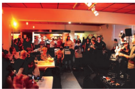
Le groupe White Line a entraîné les participants dans une danse finale festive et conviviale