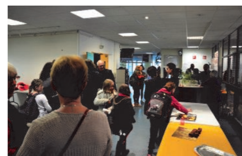
Buffet organisé par le CQ5, après la conférence

Après-midi théâtre « Dentrées périssables » : samedi 7 avril