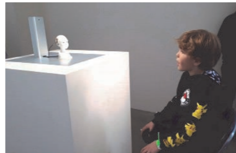
Exposition d'art numérique et robotique