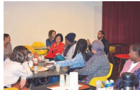
'Pti'Déj' autour du spectacle « Boobs », à l'occasion du Mois de la parentalité