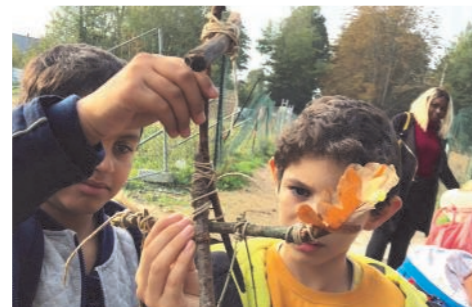
Jeu de piste en forêt