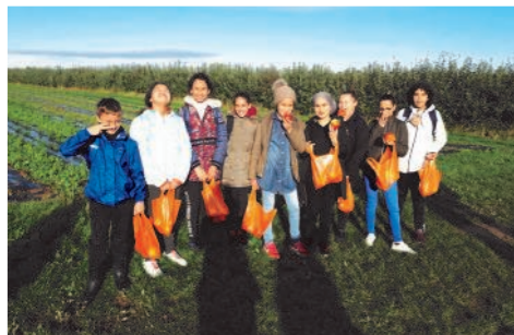
Sortie cueillette au verger de Champlain