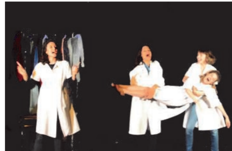
Spectacle présenté par Lovely Cie dans le cadre de la campagne « Octobre Rose »