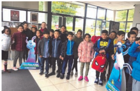
Sortie au cinéma du Palais