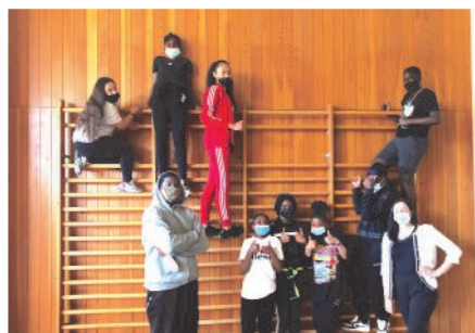
Projet Un pour tous, Tous pour Créteil !