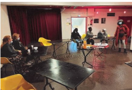
P'ti Dèj des parents, jeudi 20 mai à l'espace bar