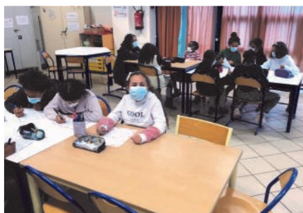
Atelier radio périscolaire