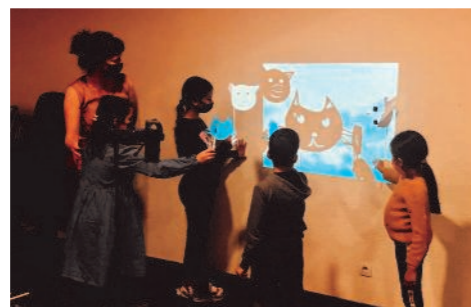
Atelier Bizarre, Bizarre