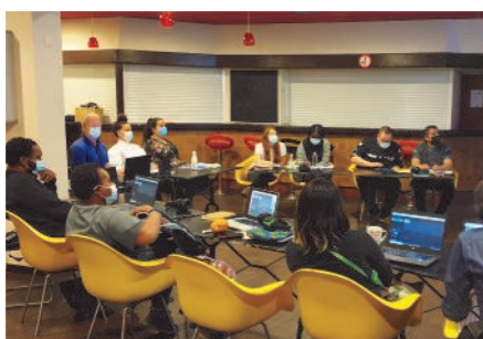
Formation radio pour les animateurs des centres socioculturels