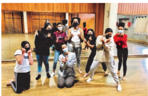
Atelier Vis ta différence