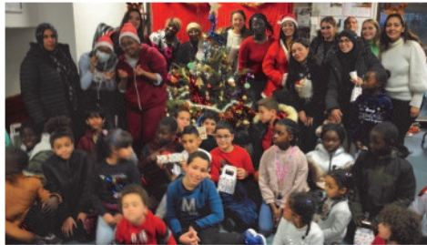
La fête de Noël avec les enfants et les familles