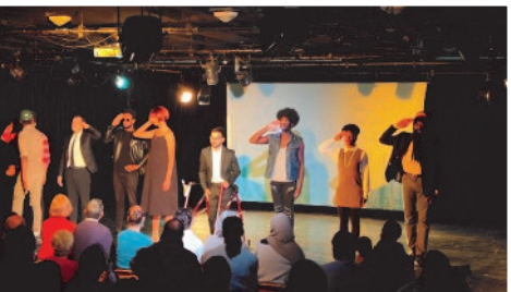
Œuvre commune : photo de tous les participants