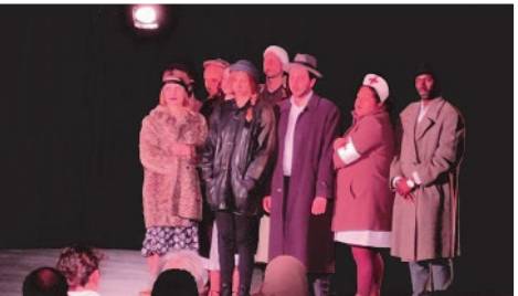
Œuvre commune : atelier théâtre de la MJC Club