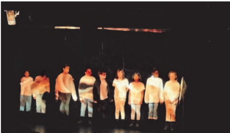
Œuvre commune : Association Zoom