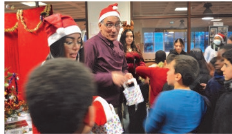
Distribution de pochettes surprises aux enfants