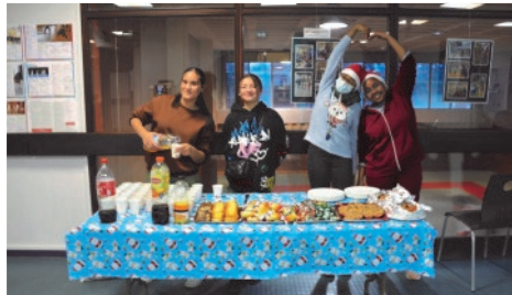
Goûter préparé par le collectif de jeunes