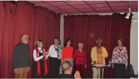
Temps Fort du Théâtre Amateur : « Apéro poétique » et « Apéro Slam et Jam » à l'espace bar