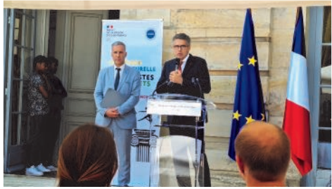
Cérémonie de lancement de l'été culturel 2023, avec la présidente et la directrice de la MJC