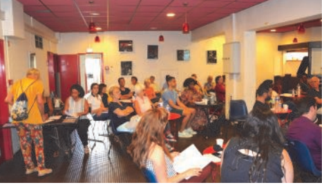
L'Assemblée Générale annuelle de la MJC Club, à l'espace bar