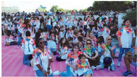
Jour de Fête, les participants de la MJC