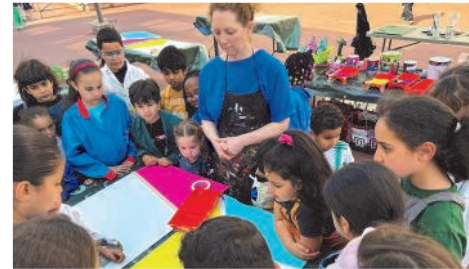
Ateliers artistiques animés par les « Plastikeuses », place de la Croix des Mèches