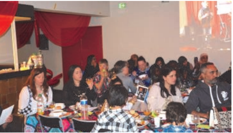
Soirée orientale au MuZiK'club, s'ouvrant par un repas accompagné de danse