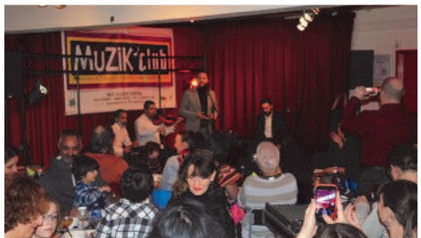
La deuxième partie a été consacrée au concert assuré par quatre musiciens ...