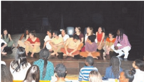
Dialogue des artistes avec le public