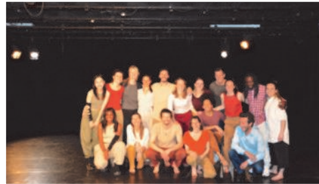
Photo de groupe des artistes