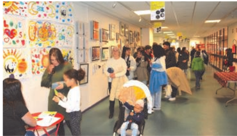
Carte blanche danse : arrivée du public